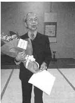
筒井氏米寿のお祝い