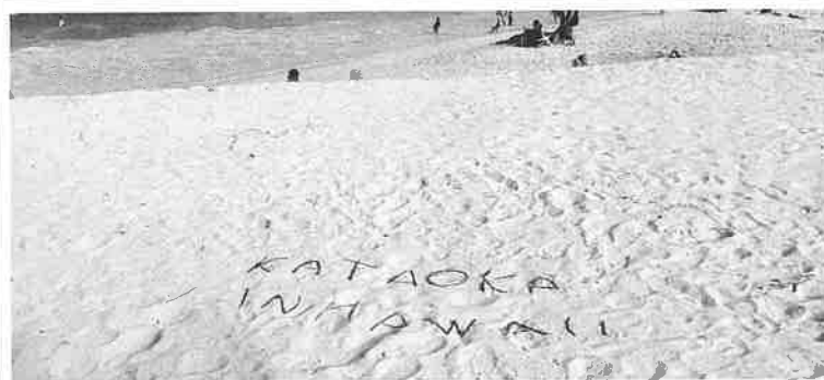
カイルア・ビーチ [KATAOKA IN HAWAII]

噂に聞いていたとおり、ハワイは日本人が多く訪れるところなので観光地となっているワイキキビーチ周辺にはホテルがたくさん、日本語を話せる人たちも多いので片言の英語でも十分にやっていけるところだなと思えました。フレッシュユナパッションフルーツもおいしかったし、また行くことができたら今度は真夏の季節に行つて、今回行けなかったノースショアのあたりに海に入りに行きたいです。(H22年 国際コミュニケーション学部卒)