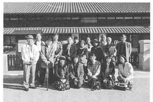
ミツカンミュージアム入口にて