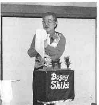
ボギー志貴氏の手品