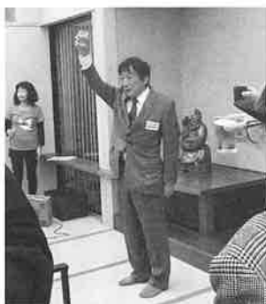
乾杯 黒柳愛知大学名誉教授