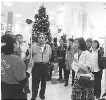
めんたいパークとこなめにて