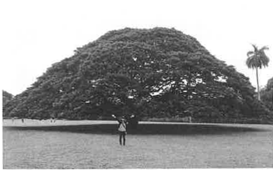
「この木なんの木」モンキーポット

私にとっては、ハワイに行くのはこれが初めて。実は私は、幼少期に「この木なんの木」が使われているCMを見て以来、「こんな大きな木どこにあるんだらう、いつかそこに行つて本物が見てみたいな。あの木と写真を撮りたいな。」と漠然と夢を抱いていました。そこでハワイにその木があることを知り、ひそかに憧れていたハワイにやつと行く機会ができてとても嬉しくなり、行けると決まってから早々にガイドブックも買い、