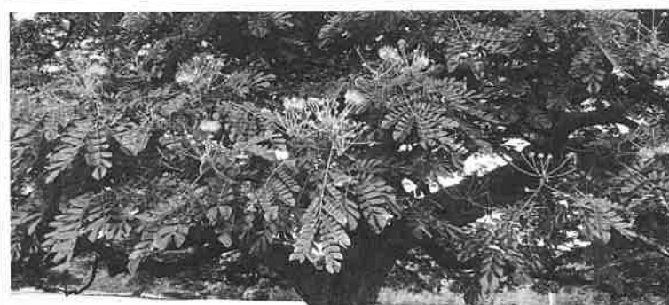
モンキーポットの花